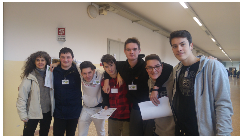
Studenti come voi